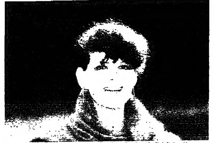
كلوديا كاردينا، في استراحة روما، وفي خلف زوجها باستيل سكوتيري